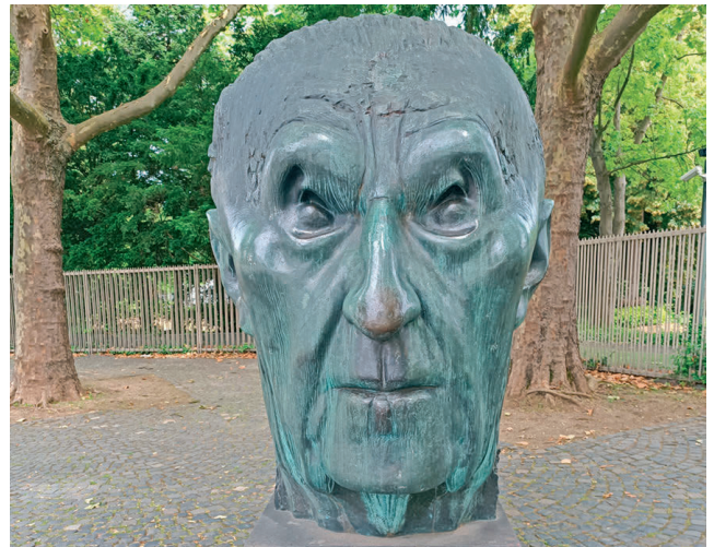
© Franz Xaver Böhm, Konrad Adenauer Denkmal

Tierschutzunterricht – an diesem Samstag: Tag des Wolfes Wer glaubt heute noch daran, dass der Klapperstorch die