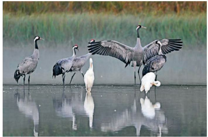
© Wolfgang Burens: Kraniche und Silberreiher am Haidenweiher

Die RSAG ist das kommunale Entsorgungsunternehmen im Rhein-Sieg-Kreis und bedient flächendeckend zahlreiche Einwohner:innen und Kund:innen in Handel, Industrie und