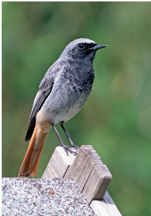
Hausrotschwanz, Vogel des Jahres 2025, © Wiebke Dallmeyer-Böhm