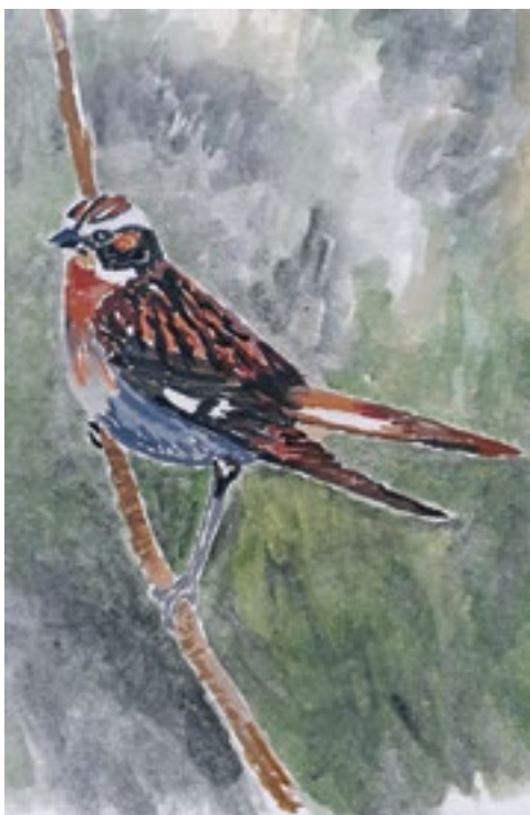
Braunkehlchen, Vogel des Jahres 2023