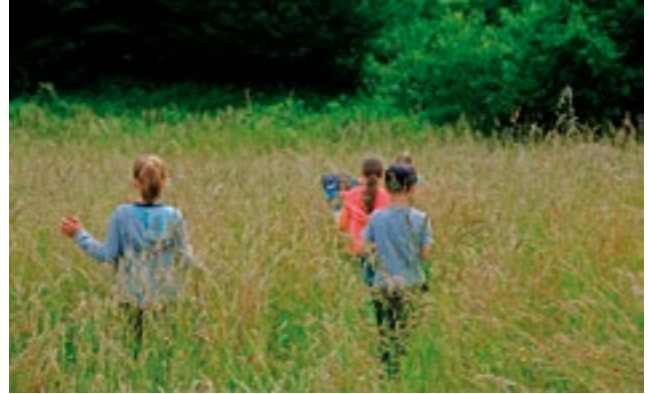
Schmetterlingszählung mit den Aggerfröschen

Monatstreff der NABU-Kreisgruppe; siehe Hinweise S. 16