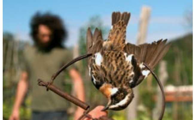
Braunkehlchen in der Schnappfalle, Italien

Taschenlampenwanderung Die Tage sind noch recht kurz und die Dämmerung kommt früh. Gemeinsam mit den Aggerfröschen und ihren Eltern unternehmen wir rund um