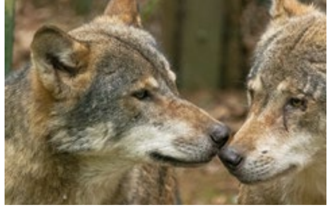
© Wiebke Dallmeyer-Böhm, Wölfe im Wildpark Mecklenburg-Vorpommern

Ort: Burg Wissem, Burgallee 1, 53840 Troisdorf