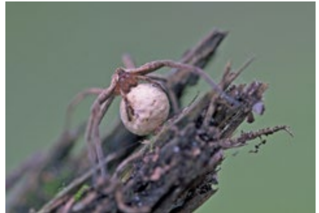
Raubspinne mit Eikokon

Ein Summen und Krabbeln all überall Mit wundervollen Bildern von Insekten in Feld, Wald, Wiese und Garten macht Frau Dallmeyer-Böhm darauf aufmerksam, was ein-